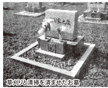
草刈りと清掃を済ませたお墓