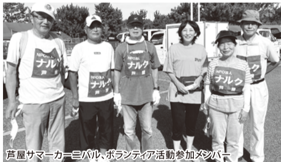
芦屋サマーカーニバル、ボランティア活動参加メンバー