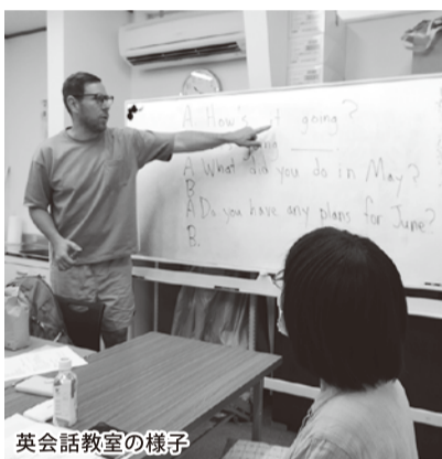
英会話教室の様子

さて、肝心の会話の方ですが、先生は私の直訳的な拙い英語をネイティブらしい言い方に直してくれます。それをもう一度繰り返して言うて覚えるようにしています。