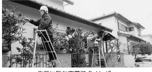
作業に励む東葛拠点メンバー

善は拠点の代表を務め、幼稚 園勤務の現役ながら、松のせ んだまでこなす技はプロ級で す。 皆さん、仕上がり出来栄え