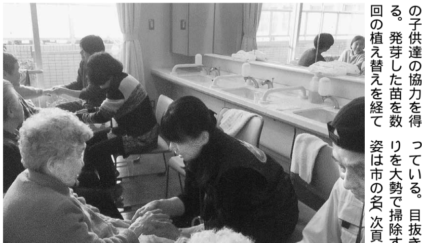
大分拠点のハンドマッサージ活動