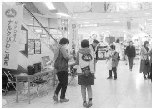
平和堂和邇店で初の会員募集キャンペーン

びわこ湖西拠点は3月7日午前10時から午後2時まで、大津市和邇中浜の平和堂和邇店1階で会員募集のキャンペーンを展開した。