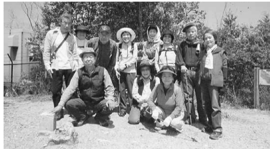
岐阜で一番高い百々ヶ峰の山頂で

中山道エコ・ウオークも無事終了し、ウオーキング同好会が発足しました。岐阜県内で、交通費のからない場所を選定して、あちこち歩きまわりましたが、行先が選定に困るようになりまし