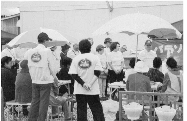
宮城拠点のバラソル喫茶