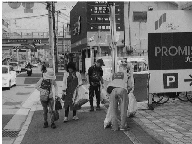
茨木・摂津拠点のクリーンアップ作戦

とりのわけ「助け合い活動(時間預託活動)」「地域貢献活動(奉仕活動)」について、基本(マニュアル)を遵守し、活動を展開してきていくが、まだまだ十分徹底できていないことも事実である。理念の再確認をすることが重要である。