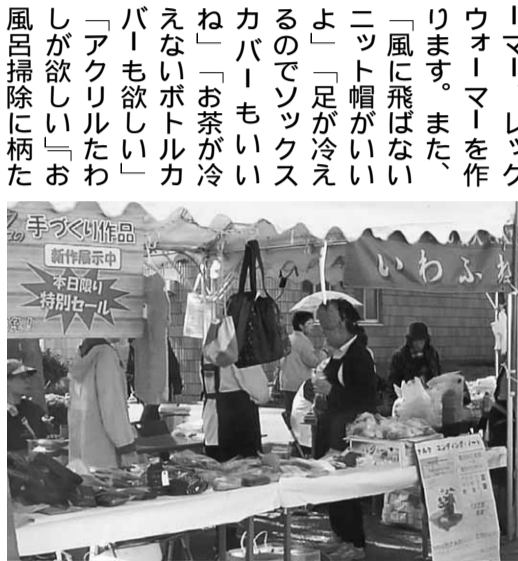
交野市健康福祉フェスティバルに出店時の様子

健康福祉フェスティバル」への出品に向けて作品作りに取り掛かっています。冬が近づき寒くなると、健康のため、首、手首、足首などを暖めるネックウォーマー、アームウォーマー、レッグウォーマーを作ります。また、「風に飛ばないニット帽がよいよ」「足が冷えるのでソックスカバーもいいね」「お茶が冷えないボトルカバーも欲しい」「アクリルたわしが欲しい」お風呂掃除に柄たわしにして」といろいろ注文がだされ、編む楽しみがさらに広がります。お稽古の途中にはお茶とお菓子をご用意され、健康のこと、病気のことで、テレビ番組のことなど話題も多岐にわたり、大変にぎやかで笑いも