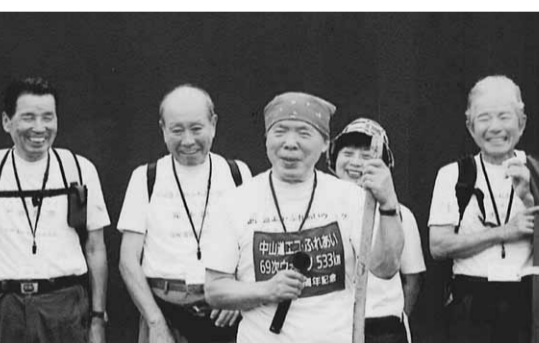
設立15周年記念中山道ふれあいウオーク