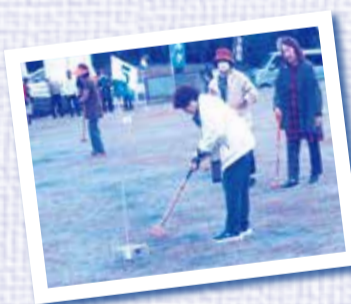
各務原グラウンドゴルフ

水戸拠点として、ナルリンピック協賛は既に2件実施しています。10月22日「秋のアトリエコンサート」マンドリン、フルート、尺八、ピアノのナルク会員の演奏会。11月16日「ナルリンウォーク」水戸市千波(せんば)公園に49名が参加して開催。大変良い天気恵まれて盛大に実施しました。