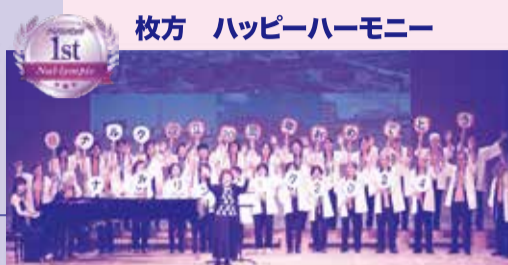
枚方 ハッピーハーモニ