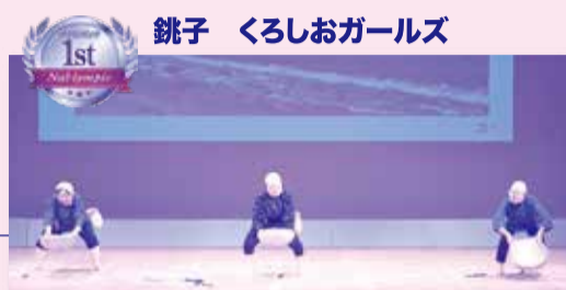
銚子 くろしおガールズ