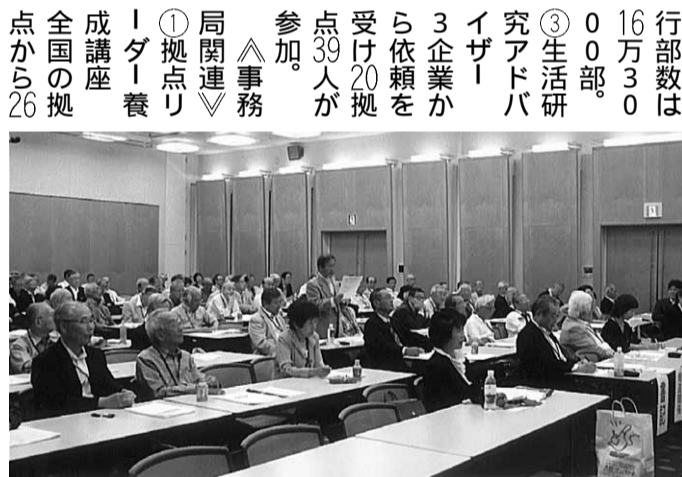
全国からの会員で埋め尽くされた総会会場