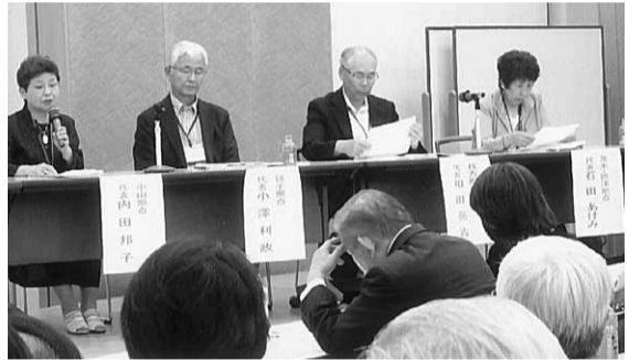
各拠点の総合事業の取組みを報告するパネラーの皆さん

その後、総合事業を受注しても、メニュー①の会員同士の助け合い活動を維持していく方針です。