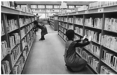
書庫の整理をする会員