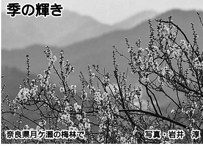
奈良県月ヶ瀬の梅林で

定年後、家に引きこもっていましたが、妻に勧められて、何となく、ナルクに入りました。パソコンが得意だとあって、事務局次長というポストを与えられてしまいました。その後、皆さんに教えられ、言われるままに、送迎やいろいろなるボラ(次頁へ)