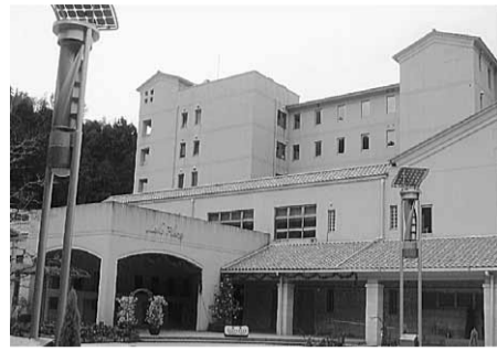
会場となったユニトピアささやま

ンティア活動、クラブ活動に参加してき痛感しました。 しかし今回の研修年「安心生活研究委員会」を発足させ、