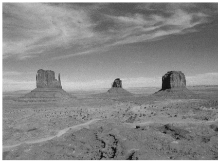
西部劇でおなじみのモニュメント・バレー

ナルクUSAも結ぶことでしょうか。高成10年。会員も倍増、畑会長は日本の実態活動も多角化、行政を紹介する基調講演からも優秀なボランを予定しています。ティアグループに認定されるに至りまします。各拠点の皆様も