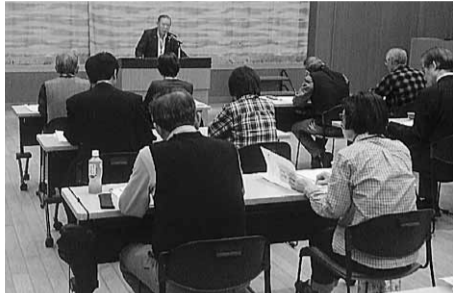
熱心に会長の話に耳を傾ける受講者の皆さん

今年も拠点リーダーの組織運営について養成講座が11月25日から2泊3日で行われ、32名の精鋭が集まり、熱心に研修が行われた。特に今年を受講者の平均年齢が昨年よりも2歳若返り、これまで以上にやる気あふれる充実したものとなった。 1日目は高畑会長「ナルク総論」で、ナルク設立の意義・基本理念とリーダーとしての心構えについて、3時間近く熱い思いが語られた。 2日目は盛りたくさん「事業活動について」と題し、福祉調査セ