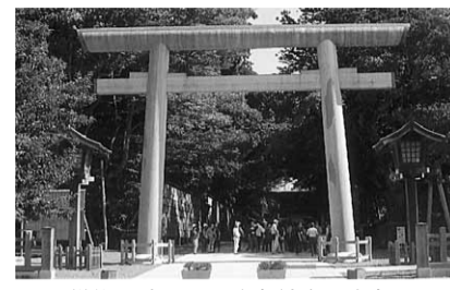
震災後再建された鹿島神宮の大鳥居