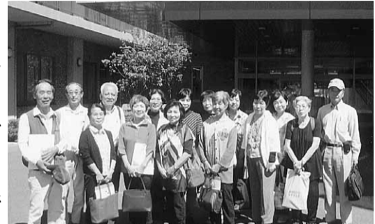
特養を訪れた委員会メンバー

亀岡拠点も設立15 年を超え、会員の平 均年齢が上がり、次 第に「自分の最終の 生活をどうするの か」という漠然とし た不安を抱えてい る人が増えてきてい ます。