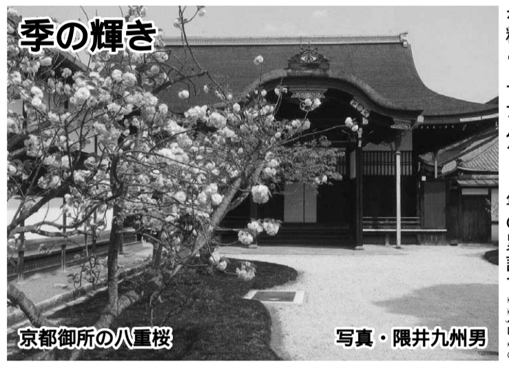
京都御所の八重桜

これらを踏まえて26年度に「シニア生活・介護支援サポーター研修」を予定しています。自らが自発的に活動するものでなければ長続きしません。高齢者が高齢者を支援する時代、今こそ私たちシニア・ボランティア団体の出番です。