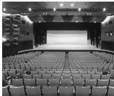
式典・総会・交流会が行われる電力ホール3か所を訪問し、ハンズオン活動が行われる。

【ホテルメトロポリタン仙台】26日 定員千名の豪華なホールで、立食パーティー形式で拠点の出し物を楽しみながら、2時間余り交流を図ることができる地域毎にテーブルを囲む。 【福島・宮城】 25日、27日 福島での被災地支援活動と視察が仮設住宅160名が仮設住宅3か所を訪問し、ハンズオン活動が行われる。 【電力ホール】 26日 電力ホール3か所を訪問し、ハンズオン活動が行われる。 【電力ホール】 26日 電力ホール3か所を訪問し、ハンズオン活動が行われる。