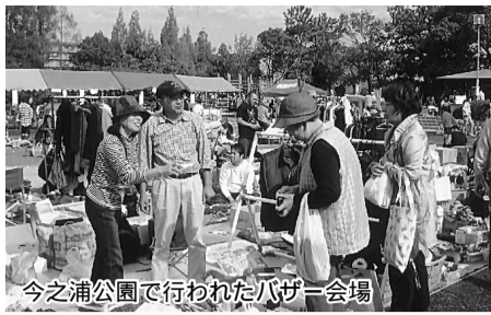
今之浦公園で行われたバザー会場