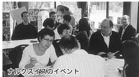
ナルクスイスのイベント

ナルクスイスでは昨年の11月13日に、チューリッヒで「日本を想う日」と題する「東日本大震災チャリティイベント」を行いました。