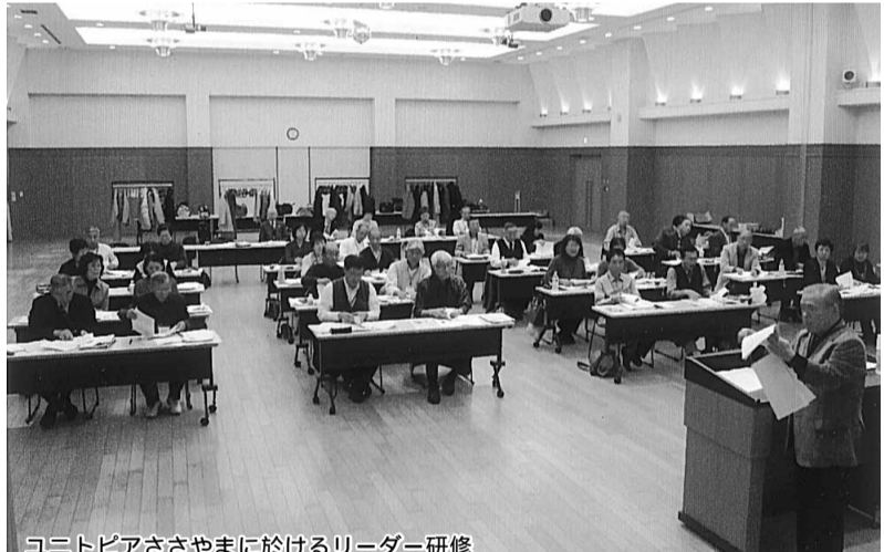
ユニトピアささやまに於けるリーダー研修