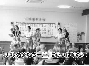
「ナルクひたち一座」はひっぱりだこ

の必要性」「ボランティヤ保険・ナルクエンディングノート」など熱心な講義と質疑が行われた。夜はグループ毎に別々の考え方というテーマで全員参加の討議を行い、まとめが発表された。この研修により全国に仲間ができて、拠点リーダーとして活躍される。新設拠点での研修の帰路はいつも重い気分になります。悲しいかな私の技量不足で、どこまで理解して貰えたかと疑問が残るのです。それは対称に、既に数年間稼働している拠点での研修は