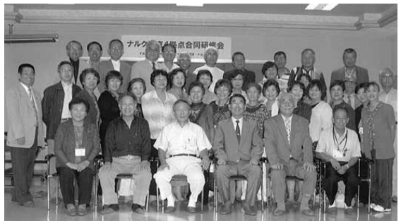
中標津拠点から「見廻りたい」の10人を限度にプロック化し、組織化する活動の原点が報告番拠点、中標津から

北海道東部地区のナルク4拠点(中標津、帯広、美幌、釧路)連絡会議が9月12日釧路市で開催された。今年度は釧路拠点が当番であり、総勢41名の参加があった。特に、今回注目されるのは昨年11月新規加入した美幌拠点より9名の参加があったことである。