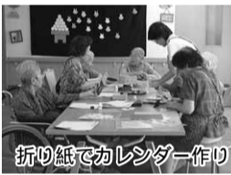
折り紙でカレンダー作り

悩みは、参加者が減ってきていることです。最近、狭山市と周辺都市では私立の幼稚園が3歳児を募集しており、小都市では参加者募集に大きく響いているのです。皆さんはこの苦しい中で元気に頑張っていました。