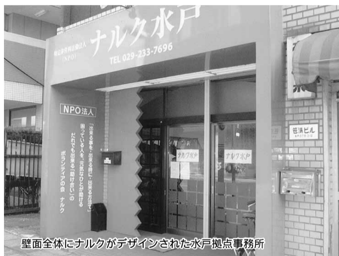
壁面全体にナルクがデザインされた水戸拠点事務所

私たちはお陰様で昨年、時間預託で9398時間という全国1位の成績を上げることができました。しかもその大半が在宅家事支援活動です。会員数も平成12年の設立時には約40名