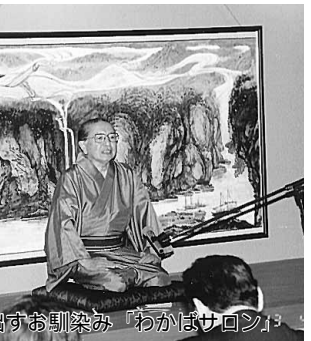
落語も飛び出すお馴染み「わかばサロン」

を開催したが70名近い参加者があり関係者を喜ばせた。久安寺という由緒ある名刹で行ったが管主の講話に一同感銘を受け、楽しい中にも格調高いサロンとなった。最近では老人大学で落語を学ぶ人も多く、この日も2人の会員が落語を披露した。この「わかばサロン」は新しく独立する箕面でも、今までの経験を活かして市民にも開かれた高齢者の居場所作りの中心になっていた。筆者も感じた次第。箕面の独立に伴って、同好会の中には解散を表明するところもあるよつだが、大井代表代行は「新しい執行部ができてから、またぼつぼつ立て直していきます」と、焦らず騒がずの姿勢である。北摂にまた大物代表が誕生しそうだ。(記・山田芳雄)