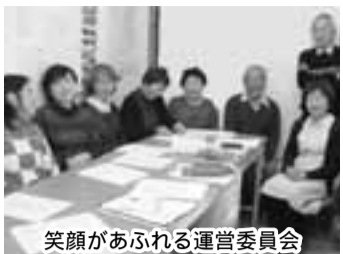
笑顔があふれる運営委員会

ナルク泉州「さくら」はナルクの活動を紹介したNHKの「クローズアップ現代」に特集されて大阪府南部にある岸和田市に、平成16年4月に設立され、昨年3月で会員87名の若い拠点です。岸和田市は「城とだんじりのまち」で有名ですね。 (1) 会員が約50%アップの底力はどこから？ 2年前から、「ご好意で事務所を借りることができましたが、その家賃2万円の捻出が大変でした。そこから「さくら」の皆さんの底力が発揮されました。まずは建物の内装を腕に覚えの会員が担当して改装し、介護施設に関係のある会員が施設から活動の依頼を受けるために奔走、また事務所ができたことで意思疎通が生まれ、次々に活動が広がったのだそうです。まさに苦労をプラスに生かした皆さん