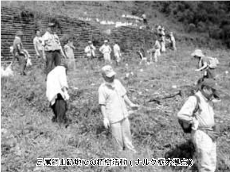
足尾銅山跡地での植樹活動(ナルク栃木拠点)