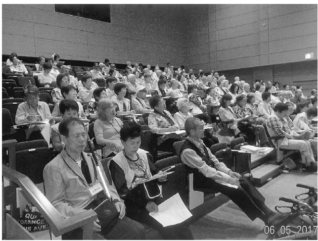
154人が出席した栃木拠点の総会

6月5日(月)第18回定時総会を実施しました。総会は多くの会員さんと顔を合わせる絶好の機会として位置付けており、年3回の全体交流会(新年会、暑気払い、芋煮会)とともに、重要な行事として100人規模で行います。中でも総会は常に150人以上が目標です。利用者の会員にも参加を呼びかけ出席いただきまし