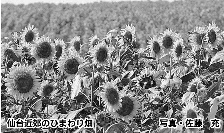
仙台近郊のひまわり畑