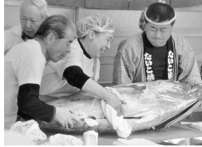
マグロの解体ショーも友情出演

大会議室の定員が120人に対し、元仮設(被災者)の方だけでも170人だけ、報道関係4社弱、駆け作りの場とな