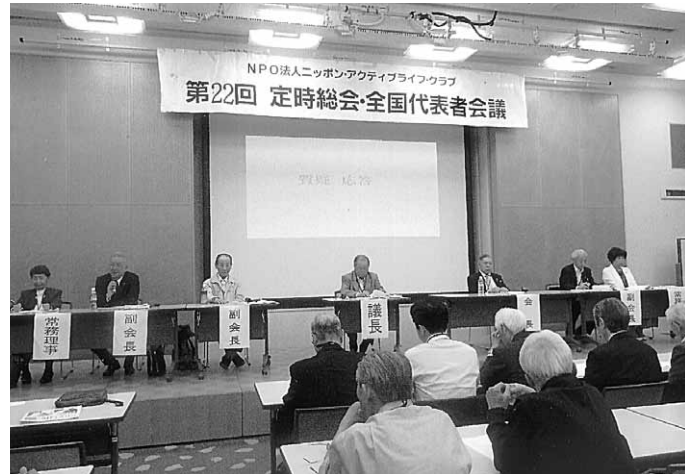
活発な質疑応答が繰り広げられたナルク第22回総会

①会員の動向 昨年同様、退会者が入会者を上回る現象は変わっていない。3月末の会員数は1万7151人で、838人の純減。しかしながら一方で1340人の入会者も。時間預託が活発な水戸拠点や徳島拠点は地元紙や市の広報紙・ミニコミ誌などにナルクの説明会開催の