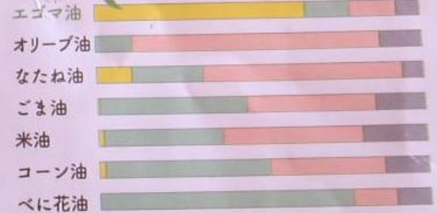
主な植物油の脂肪酸組成