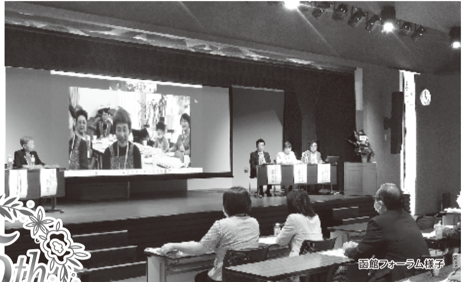
函館フォーラム様子