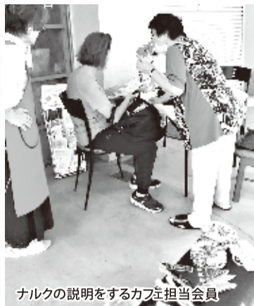
ナルクの説明をするカフェ担当会員

また部活動ではコーラス部に入りましたが、こちらでも楽しくて、声も正常に戻りました。これからもナルクで充実したボランティア人生を送っていききたいと思います。人生ナルクが必要だ。