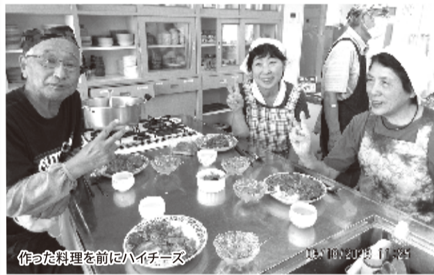
作った料理を前にハイチーズ

今年の夏は日本全国どこでも暑く、ナ料理のレシピで、各々が一生懸命熱心に「地球温暖化」どころでなく「地球沸騰化」とも言われるくらい暑い毎日です。カレーは赤、緑、黄色の金曜日、再開2回目に彩りよく出来上がりまの料理教室が開かれました。そこにカラッと揚げたカツを盛り、食べたカツを盛り、食べながらにぎやかにカレー談議に花を咲かせました。いわく、「うちはリンゴをすりおろす」「インスタントコーヒーを1さじ入れると香りと味が良くなる」「味噌を少し入れると香り」など、皆さんのアイデアが満載でした。次回予定は9月15日(8月18日現在)