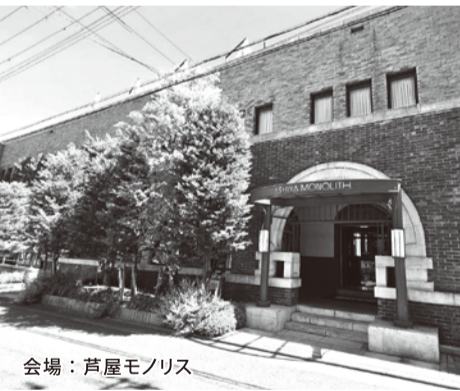
会場：芦屋モノリス

一首のカルタ、囲碁・将 棋盤等々、子ども達や年 寄り喜びそうな昔のお もちゃがイッパイ用意さ れています。