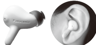
耳あな型補聴器 G4 シリーズ 医療器認証番号 230AIBZX00021Z00