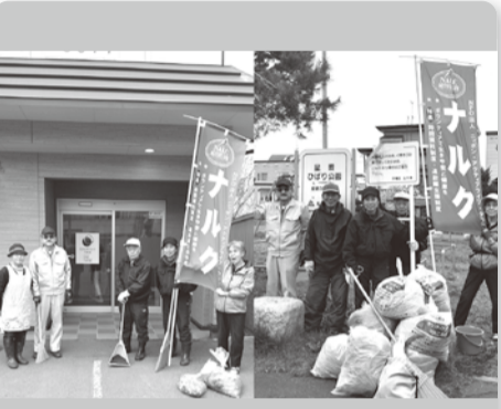
●手稲 4月20日 6人 町内会管轄のひばり公園の清掃