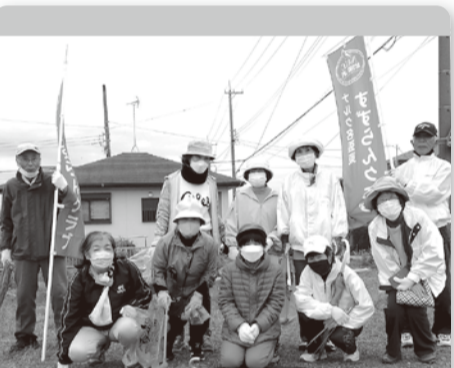
●名張東 4月25日 15人 すずらん台の幹線道路。会員外3人参加