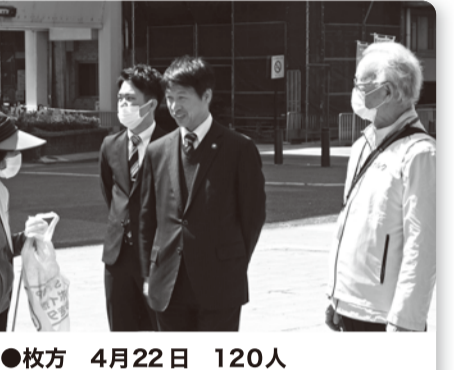
●枚方 4月22日 120人 ①枚方会場(岡東中央公園、京阪枚方市駅、天野川両岸遊歩道)②楠葉会場(楠葉中央公園、京阪楠葉駅前)③けやき通り(枚方八景に選ばれている地区)