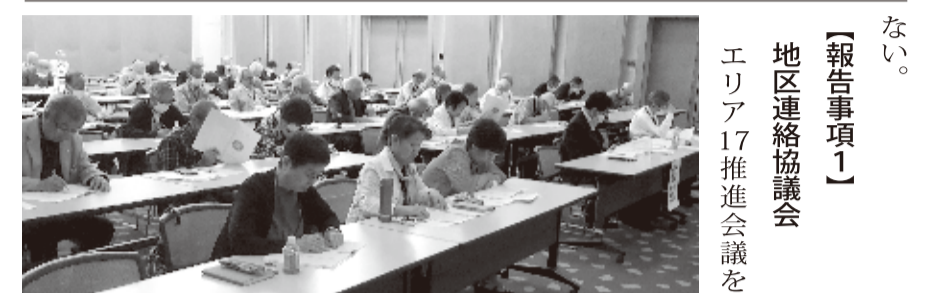
【報告事項1】 地区連絡協議会 エリア17推進会議を

●ボランティア保険・活動時間数が少ない割に事故件数が多い。傷害率も高く、保険料金は会員一人あたり163円になった。 ○決算報告はホームページを参照いただきたい。 【事業計画】 3月号の会報に掲載した通りであるが、理念を再認識しつつ、組織が継続できるように後継者を育て、経営基盤を確立することが重要である。そのためにも地区連絡協議会を強化しなければなら