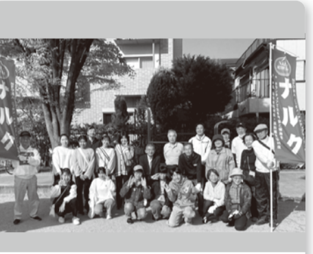
●芦屋 4月22日 11人 芦屋市茶屋之町さくら通りと西法寺。他団体とのコラボ