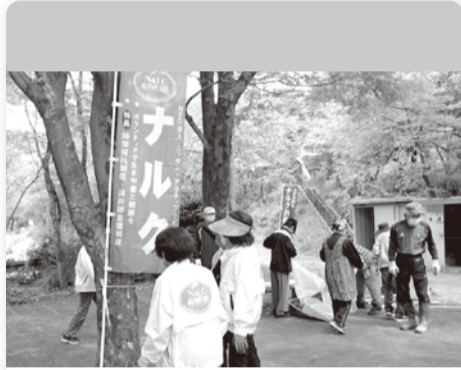
●各務原 4月18日 17人 尾崎南町運動公園の駐車場及び東屋周辺。他団体とのコラボ