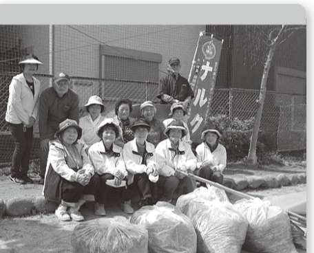
●寝屋川 4月28日 12人 市内大利元町公園とその周辺