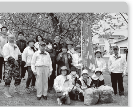
●江別 4月29日 18人 事務所地域の3公園清掃