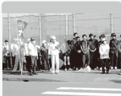
●ふくい 4月23日 柴蘭街道ライン、武生工業高校、武生第2中学校前 他団体とのコラボ