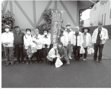
●岐阜 4月16日 15人 岐阜新聞社主催、「長良川を美しくしよう運動」に参加

参加拠点に「のぼり旗」を贈呈し盛り上げを図り、4月中に実施し、さらに他団体とのコラボの報告が来ている9拠点の実績を紹介します。(5月以降のナルクデー活動は順次ホームページにアップしていきます。)