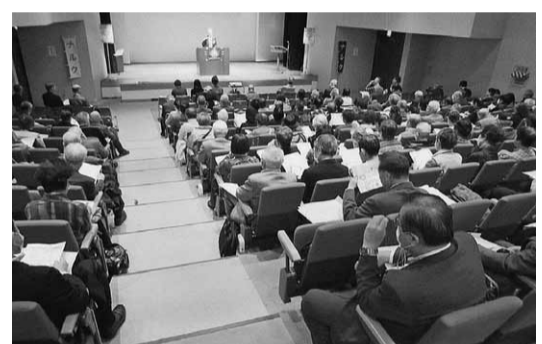
桜木町駅前の横浜市社会福祉センター