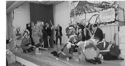
札幌拠点の文化祭