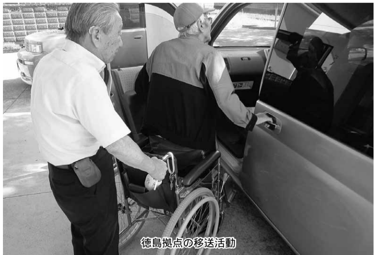
徳島拠点の移送活動

③市福祉課から在宅認知症の人に付き添って買い物や散歩などに出かける「こいつしょサービス」を受託。(茨木・攝津)