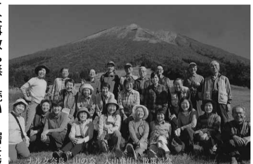
当初は会員も若かったこともあり国内だけではなく外国の山も夢見るようになり、有志を募りスイス・ニュージーランドでのトレッキングに行き、楽しい思い出となっています。

奈良同好会巡り 奈良拠点山の会 ナルク奈良拠点設立の秋、代表の肝いりで会員の健康と絆を深めるため、クラブとして「山の会」が発足しました。