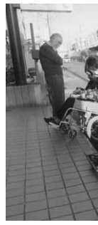
横浜拠点の研修風景