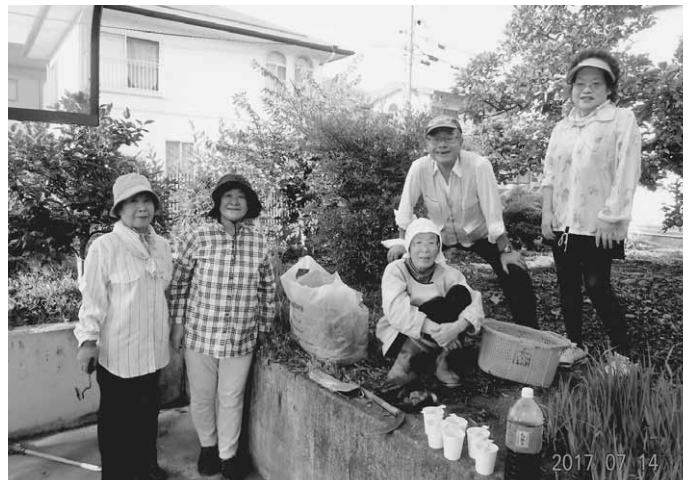
さかきの活動風景