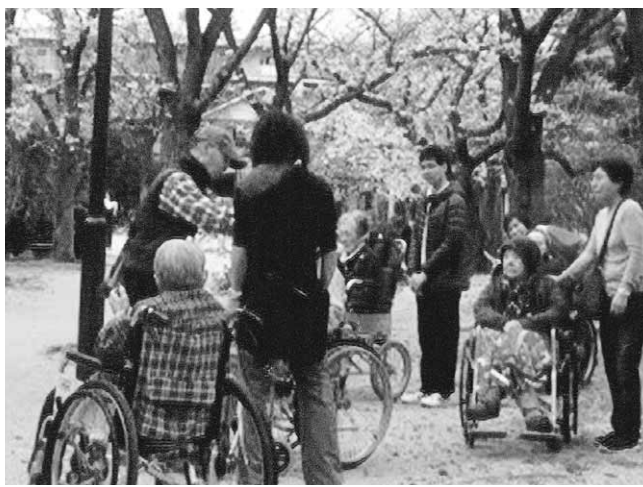
芦屋拠点 高齢者施設花見のお手伝い

具体的な活動計画 は、本部の方針に沿 って、ナルク芦屋の 総会に向けて今後案 を練っていくが、29 年度の目標であった