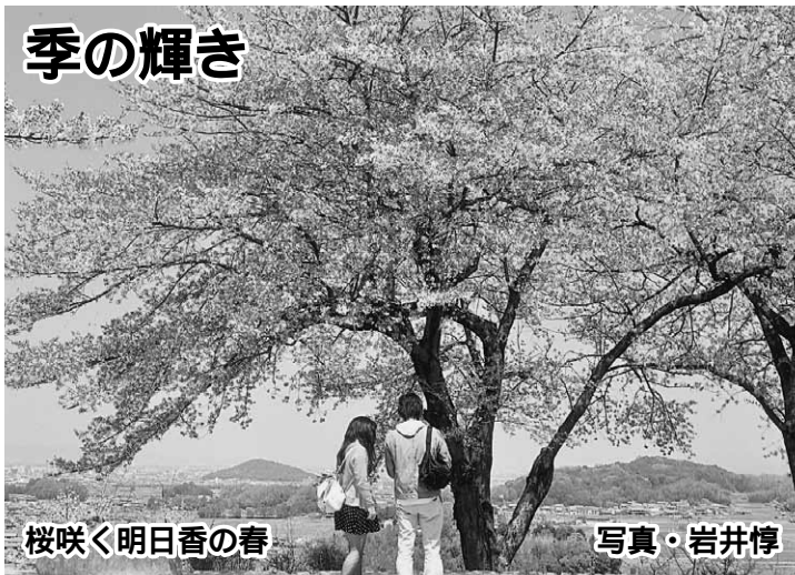
桜咲く明日香の春