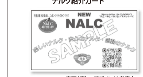
表面(案)…デザインは考案中。