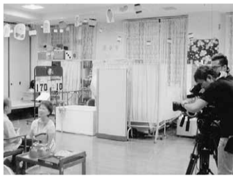
取材するシンガポール国 営テレビのスタッフ

10月8日、介護老 人福祉施設「きやら の樹」の芸能鑑賞会 に団員16人が参加、 約1時間公演した。 施設からは入所者・ 介護士合わせて約百 人が来場。「父帰る」 の小劇場はじめ、ハ ーモニカ&ギター演 奏、日本舞踊、手話 ダンス、カラオケ、 高齢化する同国が