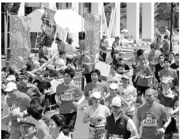
交野マラソンを応援する交野拠点のメンバー

その3は、天野川を美しくする活動への参加です。交野市には織姫伝説で知られる天野川が流れており、「天野川を美しくする会」の皆さまとともに、定期的に行われている周辺の清掃美化活動に参加しています。