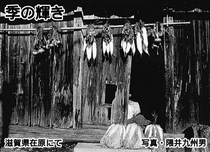
滋賀県在原にて

このフェスティバルは「お互いにふれあえるまちづくりに」をスローガンに開催され、各種団体が参加し、多彩な催しが行われ、多くの市民が参加します。中でも30数団体の模範店が楽しみの場になっていきます。 いわふねクラブですでも会員手作りの手芸品や野菜、コヒーを販売し、毎年市民から大好評を頂いています。 その2は、「ごきげんさん運動」への参加です。交野市では地域のつながりを深め、子供やお年寄りの見守り活動や地域の防災対策にもつながる「ごきげんさん運動」、すなわち「声かけ運動」が行われています。いわふねクラブでは、この中の主要駅前の朝のあいさつ運動に参加し、市長