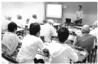
「わが家の防災」研修会 での災害への備えを学ぶ

【堺北】 万緑の真只中よカフエテラス 夏草やわがまま一杯生きてをり 植系をへし早苗に風の生れけり