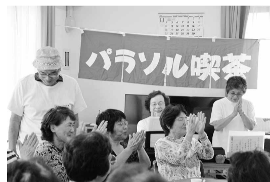
再開・再会しました

に支援をしてきています。その事、由はハッキリして、孤独死を続出させた阪神淡路大震災からの教訓があったようであ