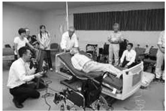
新テキストを使った研修風景(栃木拠点)

ナルクの拠点からの注文と併せて、行政からの問合せが多く寄せられています。既に昨年9月から「会報ナルク」に「介護サポーター研修・日常生活支援研修」シリーズで情報提供してきました。今一度「会報」を参考に全拠点が一斉に「時間預託活動の推進」「総合事業推進」のため、会員自身「介護力・介助力」をつけるため、ぜひ拠点挙げての研修会を実施していただきたいと思います。