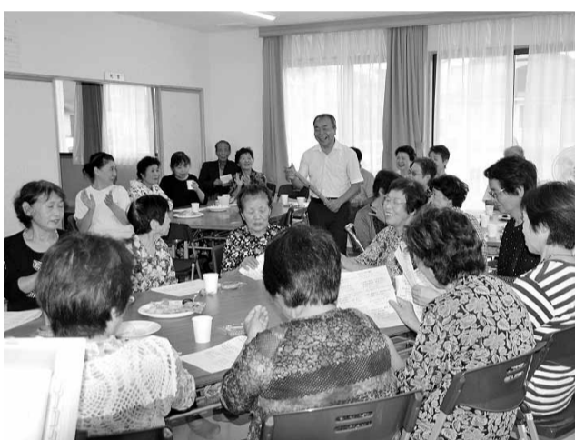
民謡はみんなを元気に明るくする

「パラソル喫茶を再開してほしい」との声が多く寄せられていたからである。パラソル喫茶は昨年12月で完全に「閉店」としたにもかかわらず、声を寄せて来た人の大半は、かつて仮設住宅で自治会長をしていた人、あるいは役員クラス、今も災害公営住宅の自治会で、指導的立場に