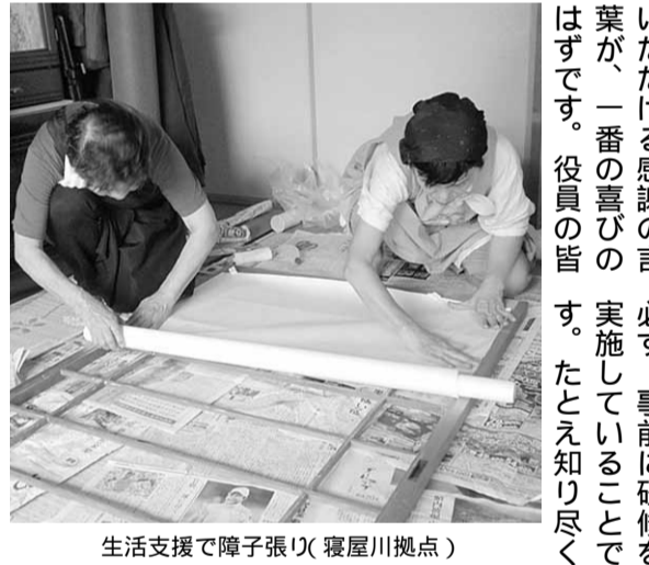
生活支援で障子張り(寝屋川拠点)

「助け合い」の理念に賛同して入会、将来の利用を期待して提供として活動してきたが、果たして支援を受けられるか？と心配する会員も年々、増えています。これらの現象は、ナルクとしては非常に情けないことです。