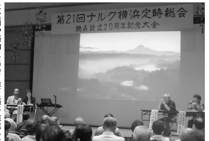
盛会だった横浜拠点の20周年総会

また、他団体の女性責任者に接したときは私の方がホッと安心します。 男女共同参画といつも、このように感じるのには、私の中にはまだまだ差別的な意識があるのでしよう。 本部の総会が終わると各拠点での総会が始まります。拠点の10周年、20周年といった記念総会には基本的には会長が出席しますが、都合で私や副会長が参ることもあります。そんな中で工夫を凝らし た企画や感動に出会うことがあります。横浜拠点では20周年を一つの行事として終わるのでなく、新しい活動につなげようと、4分野でプロジェクトチームを作りしました。それは①会員拡大②生活支援・助け合い活動を増やす③八十路会の発足④成年後見制度への取組みです。 ①の会員拡大は500人を目指していましたが早々に達成し、記念総会の日にはチームを解散してしまいました。 私が注目したのは②の「助け合い活動を増やそう」です。横浜拠点は元々施設活動が中心であり、また収入の多くもここに頼っている事情があります。それが高齢化の波の中で必