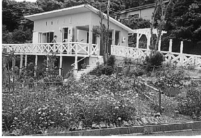
完成した美咲の家

【随想】 訪れた。 文字通り花いっぱい の敷地の斜面の上の方に 建てられており、道路から 車椅子でも入れるバリア フリーの設計。3・55間 x2・5間、18畳の広さ。 母屋の「花田族の家」と は天空の回廊で結ばれて いる。宿泊は4〜5人が 可能。「ナルク会員に利 用して欲しい」と建設さ