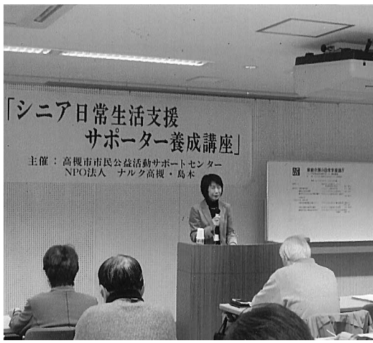
新テキストによる研修風景

「シニア生活・介護支援サポーター」張東「茂原」「茨木・摂津」「高槻・島本」「奈良」「川崎」「大阪南・大阪北合同」の11拠点で