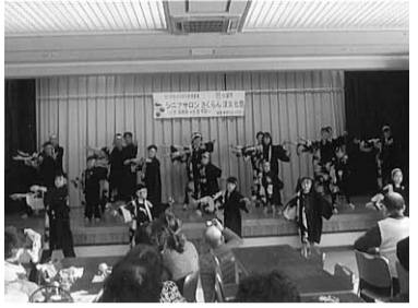
さくらんぼ10周年の文化祭

この文化祭は札幌拠点 の一大イベントである と同時に、今年の集大成 もあり、会員は準備万端 を整えてこの日を迎え た。