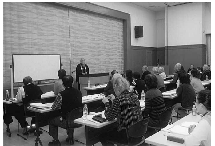
「ナルクの活動は釈迦の道に通じる」と語る講師と受講者の皆さん

「老」「病」「死」という四つの問題を 「老」「病」「死」という四つの問題を 「老」「病」「死」という四つの問題を