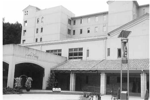
講習会場・ユニピアさやま全景

せつかく入会して、今年、函館拠点は事務局の電話がひっきりなしに鳴るようになり、各拠点の活動も盛況です。