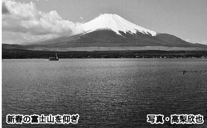
新春の富士山を仰ぎ