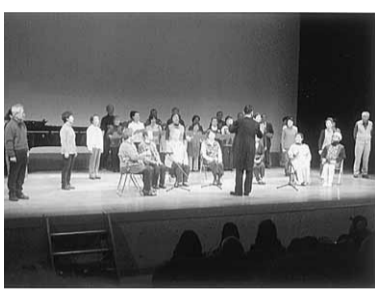
大舞台で初演「虹のひろば」

「東横浜」 平成16年9月、東京 等々力渓谷を皮切りに、 隔月開催で始まった「か けはし健康ウォークの会」 も、8月に100回を迎 えることになりました。 平成21年からは毎月開 催となり、東京・鎌倉・ 川崎・横浜の鉄道沿線を 歩き回ってききました。 日常を離れ、樹木や 花々をめで、木漏れ日 中をさわやかな風に吹か れ豊かな自然や新しい発 見を求め、なかなか一人 では行けない神社・仏閣 を解説付きで巡ってきま した。 あまりの寒さに持参の