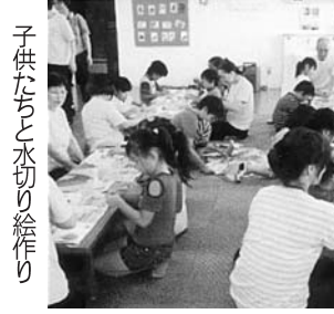
子供たちと水切り絵作り

「札幌」 多世代交流で公園を清掃 札幌拠点は7月25日、 さぽーとほっと基金「オ ナ」