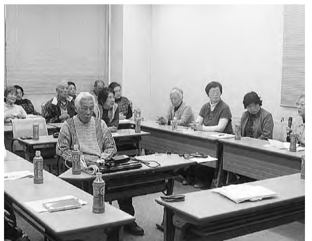
徳島拠点でのコーディネーター研修風景