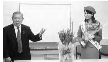
本部を訪れた富山のチューリップ娘と