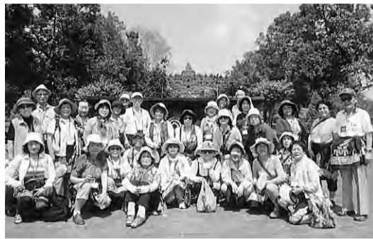
インドネシアを訪問したナルクの一団

で、2012年7月、外壁にはインドの古典情詩「ラーマヤナ」のレリーフが「死ぬまでに見たい絶景」で、みごと第1位に選ばれました。