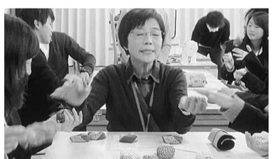
お手玉遊びを伝授するナルクの会員

「むっちゃ、成功させたあ！」と3個のお手玉を両手に持ち、「投げ玉遊び」に夢中の女子生徒。片や、6人ほどが輪になり、「もしもしかめよかめさんよ」と歌いながら「お手玉回し」に興ずるグループ。男子生徒も女子生徒も、お手玉を手に無邪気な笑顔を爆発させている。