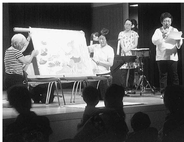
大型紙芝居にアンサンブルの奏者も効果音作りに協力

これは同拠点がナルクのPRと会員獲得につなげようと、3年前にまず、島本地区で「ピアノ演奏と大型紙芝居の集い」と大型紙芝居の集い