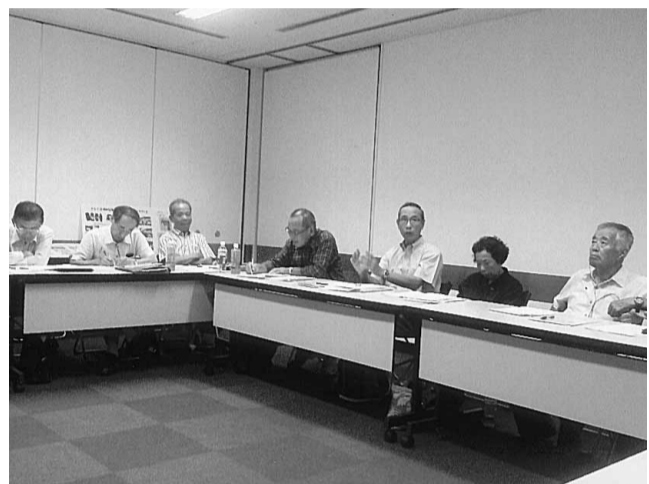
京滋地区の事務局長会議 於・京都ひとまち交流会館

またシルバード大学へのアプローチが功を奏して、ナルクで同窓会ができるくらいの人数になったと言っ拠点等々。