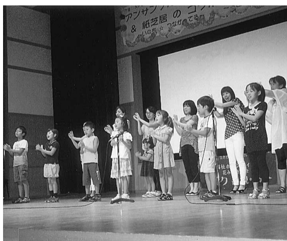
会員となったヤングママと一緒に手話と歌を披露