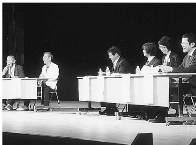
感動的だったパネルディスカッション

15時過ぎからは、交流会が始まった。仮設住宅の代表者を招き、歌や踊りで全国の会員が交流を図ろうというもので、最初に登場したのは石巻北高校のジャズバンド。震災を乗り越え、立派に元のクラブ活動を続けている。2番手がナルク大阪の「J&Bコーラス」。40人のメンバーが「ナルクの歌」ほか3曲(次頁へ)