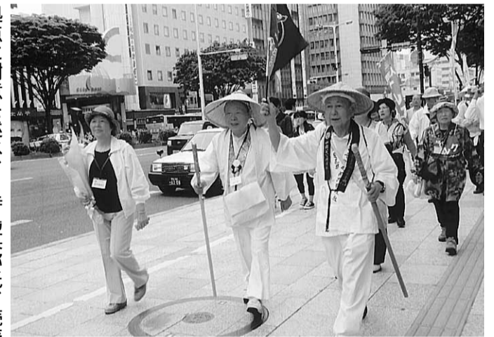
荒浜慰霊碑、仙台市内行進などの慰霊ウォーク