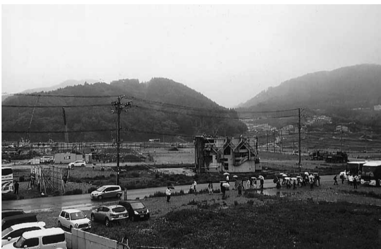
女川の道路沿いには、まだ横転したままのビル(写真中央)が横たわる

石巻、女川の1日コース被災地見学 明けて5月27日(月)は、被災地見学である。1日コースと半日コースに分かれ参加者800人余りは、11台のバスに分乗して仙台駅を出発した。 半日コースは、閑上地区、荒浜地区の見学(前頁「慰霊碑ウォーク」を参照)。 1日コースは8時30分の出発。出発にあたって、仙台拠点の担当者バスガイドさんから、「被災地では大声でしゃべらない、Vサインをしての写真を撮影をしない、現地の人にカメラを向けない」など、当然のマナーを注意された。 訪れる人々の振る舞いが、被災地の方々を苦しめていることを知り、心してスタートした。 最初に訪問したのは、多数の犠牲者を出した石巻市の「大川小学校」。