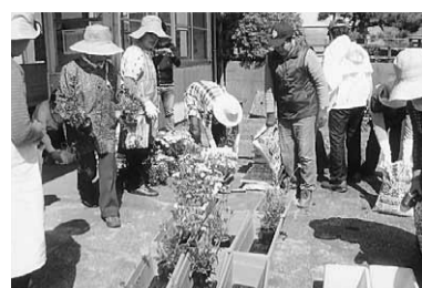
花植えに励む銚子のメンバー

「銚子」 銚子電鉄の駅に花 植え 4月24日午前9 時に、ナルク銚子 の会員24名が銚子 電鉄の海鹿島駅に 集合、駅員さんと 一緒に、駅の草取 りとプランターへ の花植えを行いました。 来銚子のお客様 様を温かく迎えたいと、 電鉄さんから依頼を受け たものです。