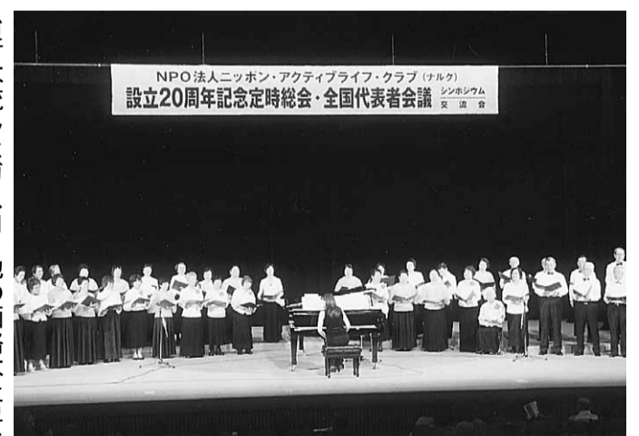
コーラス・磯節・ジャズバンドなどの交流会