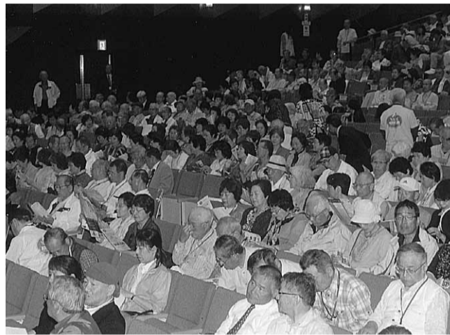
1000名を超えるナルクの会員で埋まった仙台電力ホール

早めの昼食の後、11時45分から、いよいよ20周年の記念行事が始まった。定員1000名の仙台電力ホールは、既に立錐の余地もなく超満員。シンポジウムは堀田力氏(さわやか福祉財団理事長)による基調講演でスタートした。千名を超える聴衆を前に、堀田氏は「地域包括ケア」の重要性を、この大きな壁が横たわっている。堀田氏は地域の減少化社会の中で、私たち果敢として後まで自宅で暮らせるのだから。地域で医療や介護、生活支援のサービスが本来にできるのだから。行政のタテ割りが組織の弊害、介護や