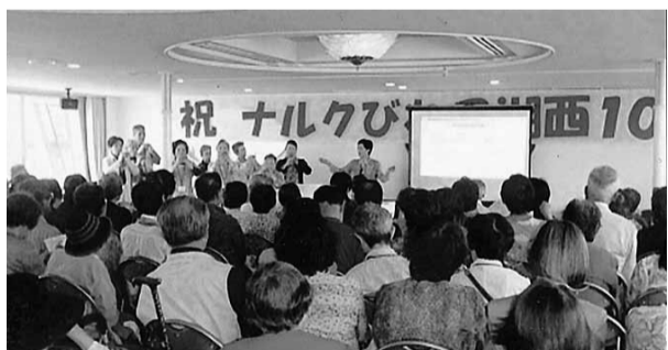
ピアンカ号船上での10周年記念パーティー

6月3日、第10回の定時総会と、拠点設立10周年記念パーティーを琵琶湖の湖上で開催した。イベントが行われたのは、大型観光船「ピアンカ号」の船上。参加者は来賓、近隣拠点の仲間も入れて178人というマンモス総会になった。