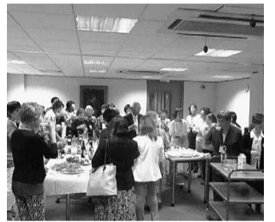
華やかな設立パーティー