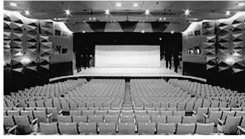
総会、シンポジウム、交流会が行われる「東北電力ホール」