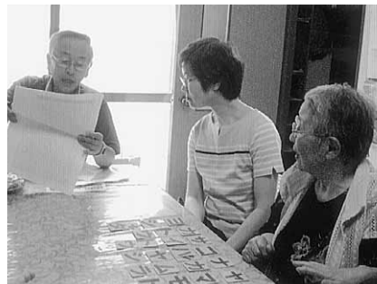
「認知症予防ゲーム」を開催する札幌拠点のメンバーたち

ナルクの女性拠点代表は全国で32名(平成25年6月現在)。この春の総会で、4名ほど増加した。彼女らは日夜、男性の副代表、事務局長、運営委員の先頭に立って、立派に拠点運営に当たっている。その手腕はまさに男性に勝るとも劣ることはない。しかし、その陰には女性なるが故の悩みもあるのかも知れない。12人の女性代表に、それぞれの思いを語ってもらった。(原稿到着順・敬称略)