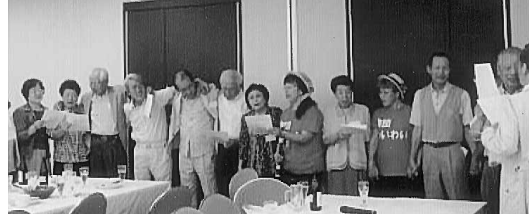
「琵琶湖周航の歌」を歌う参加者

「寝屋川・東神戸」 寝屋川拠点と東神戸拠点の総会に出席した。いずれの拠点も1年間の活動がDVDにまとめられ、食事中にも観ることができた。ここでもI T化が進んでいる様子が見えた。