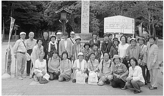
復興支援のバス研修

東日本大震災復興支援のため、福島県と茨城県へバス研修を行うなど、私たちがすぐに行けるお手伝いをしていきます。そのほか、昨年はアルミ缶回収をした収益金で、市の協働へ車椅子3台を寄付いたしました。