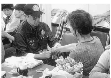
筆者がハンドマッサージをする様子