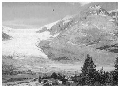
氷河期の名残をとどめるコロンビ大氷原