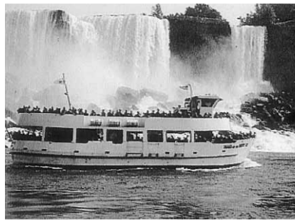
大迫力のナイアガラの滝と「霧の乙女号」