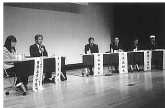
東大阪でのパネルディスカッション

独死対策も大事だが、それは包括ケアの一部であって、大切なのは地域包括支援センターをコアに、コミュニティネッ