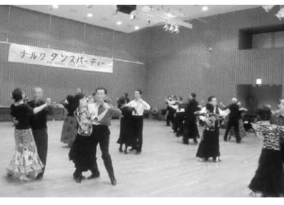
ナルクダンスパーティーの様子

「びわこ湖南」 10カ月目を迎えた いきいき百歳体操 昨年始めた「いきいき百歳体操」は10カ月を迎えました。 2月21日に草津市長寿福祉課から担当の指導員に来ていただき、6カ月ぶりに日頃の体操の効果を測定する「体力測定」を行いました。 最初に片足立ち、5分歩行、ボール回り、柔軟性の4種類の運動を行い、データをとりまく。続いて「いきいき体操」をしている間に、前回のデータと比較し、詳しく説明を受けました。 体力効果以外に「友人