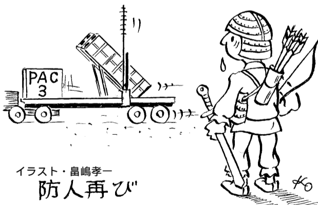
イラスト・島嶋孝一 防人再び

倭(にほん)は、百済の聖明王から仏像・経論などを献じられて以来、百済との交流をはかり親交を深めてきたが、斉明天皇6年(660年)百済は唐・新羅の侵攻により滅亡した。天智天皇2年(663年)倭は百済を救うために、上毛野君雅子(かみのけのみわくこ)などが2万7千人を率いて新羅と戦ったが、8月白村江(錦江河口付近)の海戦で大敗し、百済復興の望みは全く絶えた。