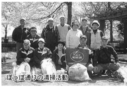
ぼっぼ通りの清掃活動

支援活動、世代間交流喫茶の運営、配食等々です。会員の入会動機は「ボランティア活動がしたくて」「セカンドステージの充実」「夫婦で活動することでの生活の充実」仲間づくりといったところが目立ちます。従いまして会員の皆さんは参加している活動が時間預託活動とか奉仕活動であることをあまり意識していません。エリア内では行政の福祉施策が充実されている、地域社会での多彩な支え合いが確立されています。これは嬉しいことであり、誇りでもあります。木地代表は「会員は社会貢献への意識も高く多くの可能性を秘めています。顔の見える関係を強めることにより皆さんと一緒に新しい方向性を探りたいと思います」と言われます。(記:日比野昌弘)