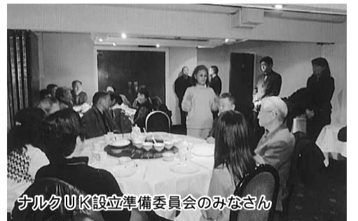
ナルクUK設立準備委員会のみなさん

関空から22名、羽 英博物館は拝観料無田から12名がテイク料と聞いてびっくりオフし、フランクフです。時間の関係でルトで合流、15時間 1時間ほどしか見学かけてロンドンに到着しました。時差ボケでその夜は眠れませんでした。