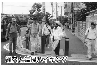
颯爽と清掃ハイキング