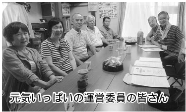
元気いっぱい運営委員の皆さん

船橋市内目抜き通り等を歩いて路上のゴミを拾う「清掃ハイキング」と船橋市から委託を受けた公園の清掃です。18名の会員が参加、路上のゴミを集めた後、公園の草取りと清掃を実施。その間の皆さんの和気藹々で元気一杯の雰囲気