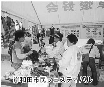
岸和田市民フェスティバル

「泉州」 市民フェスタにフリーマーケットで参加 5月3日恒例の岸和田市民フェスティ