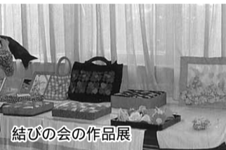
結びの会の作品展

集いの広場」を6年前から始め、最も多いときで20組になりました。子供の減少のため利用者が減ってはいますが粘り強く続けています。4、地域包括支援センターへの働きかけ 「今後の課題」 1、バスはあるものの便数が少なく、買い物は河内長野に車で出かける生活なので車の運転が必須。住民とくに若者が大きく減ってきていること併せて、今後高齢化が進み運転ができなくなった時の対策を考えておく必要があります。 2、古くからの村の人々との交流の機会が少ないので、村役場を含めて協働の場を作っていくことが求められています。悩みは大きいのですが持ち前の明るい女性パワーを発揮して困難を乗り越えていけることでしょう。(記・野村文夫)