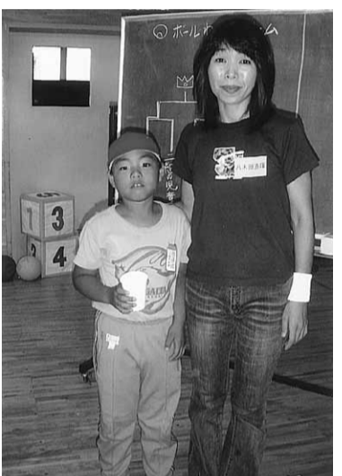
配してくれる親、兄弟がいまありません。心配で見えやうなく、皆それぞれに都合が現実にあります。それが長期にわたり助けが必要となればなおります。そんな時のナルクの存在の、なんと頼もしいことでしょうか。まさに神の助け、一筋の光でした。

私とナルクの出会いは4年前になります。その頃の私はリユーマチが悪化し、痛みでほとんど動けない状態でした。主人が単身赴任中で、私が病気になるとうつ病、家族の生活が成り立たないという事でした。