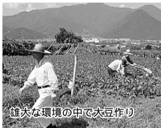
雄大な環境の中で大豆作り

プが昨年収穫した大豆で大量に仕込んだ味噌を、タッパーに詰める作業を見学し、ちよつと味見しましたが美味しく仕上がっていました。