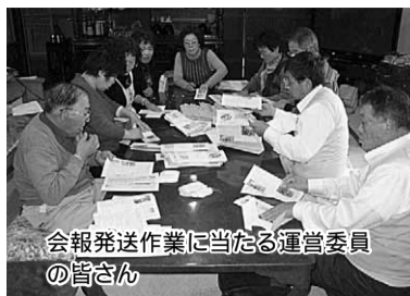
会報発送作業に当たる運営委員の皆さん

活動地域は上田市・須坂市・千曲市・坂城町・峯の原・菅平・青木村他の多くの行政区(併せて人口約30万人)に跨がり、山地を含んで縦横夫々約20kmもある広さ、利用できる公共交通機関が少ない困難な状況