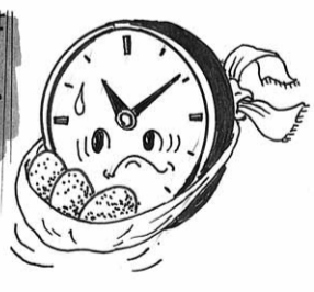
遅れてくれたって...

から、妊娠15カ月で菅田別命(ほむたわけのみこと)を出産されました。これが後の応神(おうじん)天皇です。その後、皇后は熊襲を征伐し、出雲と和を結び、瀬戸内海を東に進み、吉備(きび)を籠絡(ろうらく)しながら畿内に入ります。いわゆる大和への東遷ですが、応神天皇の異母兄の香坂皇子と忍熊皇子が反乱を起こします。皇后は武内宿弥(たけのうちのすくね)ほか諸将と共にこれを鎮め菅田別命を皇太子に立て62年に亘り自ら摂政を行いました。