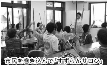
市民を巻き込んで「すずらんサロン」

「ナルクすずらんクラブ」は平成20年5月に三重県のナルク伊賀名張「生きがいクラブ」から分離独立して3年目になった拠点。奈良県との県境にある名張市の開発の一環として昭和54年に造成が完成した「すずらん台分譲住宅団地」が活動範囲です。