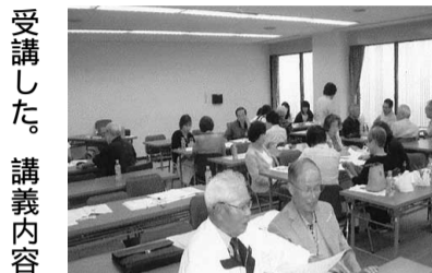
「一人暮らし高齢者」の電話・訪問活動の実施に当たり、総会後に姫路市介護保険課が催す、「認知症サポーター養成講座」を開催し23人が

若者に声をかけられ た。人懐かしそうに 「先生」と呼びかけ てきた。8年間大学 で教えていたので、 その時の学生である う。だが誰か分から ない。 私は彼の次の言葉 を待った。そして思 い出したのだ。「そ うか君だったのか」 それは7年も昔の こと、その学生の短 いレポートが私の胸 を打った。 「私と仕事」とい うテーマのレポート は仕事に挑戦しよう とする若者の純粋さ が溢れ、そんな若者 を待つ私の心情とよ くマッチした。その 度の取り組みである 「一人暮らし高齢者」 の電話・訪問活動の 実施に当たり、総会 後に姫路市介護保険 課が催す、「認知症 サポーター養成講 座」を開催し23人が