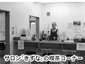
サロン「きずな」の喫茶コーナー

まず驚いたのは「すずらんクラブ」の活動範囲が、わずか幅約1km、長さ約4km、戸数約1300戸、入居者4100人の「すずらん台」の中だけであることでした。会員は所帯会員数が62名ですから約4・7%とすこ比率です。今年目標は、さらに6%を目指しています。奉仕活動への積極的参加