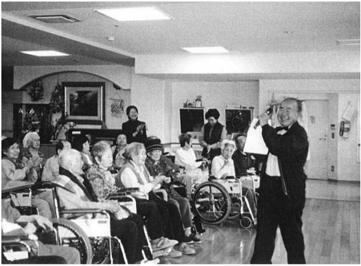
ナルクを含ま活動は自治会、社協、市役所、警察など10以上になります。多忙を糧にして、頑張っています。

に加わりました。あれから12年、千葉県の拠点は9つになりました。私は県内6番目の東葛拠点発足と共に事務局長の任につき、早くも7年になります。現在も仕事をしていますのでナルクの活動は土、日、祭、春・夏・冬休みが中心です。