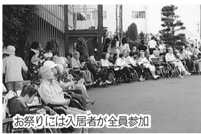
お祭りには入居者が全員参加

（トランプ・体操・カルタ遊びなど）の手伝いや話し相手、お祭りのお世話などです。施設からの要望に応えることが最優先になり、ナルクの理念でもある会員同士の助け合い、奉仕活動が二