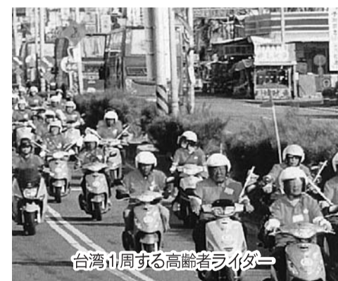
台湾1周する高齢者ライダー

台湾のボランティア団体が来日 各地でナルクの仲間と交流 昨年3月、高畑会 交流会をもち、26日長と藤岡副会長が台北には東京文京シビック市教育局から招請 クセンターで東京を受け、「時間預託 神奈川の仲間と国際フォーラム」に 流、台湾一周の映画