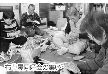
布草履同好会の集い

「泉州」 同好会が一度 に16できまし た 泉州拠点 (さくら)は 本年4月に設 立5周年を迎 え、それを機 に一挙に16の同好会 が結成された。