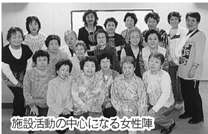
施設活動の中心になる女性陣

設立は平成8年8月で、7月末現在の会員数は、120世帯160名です。殆どの活動を福祉関係の施設で行っていたこともあり男性会員は48名と少数です。施設での活動はリクリエーション