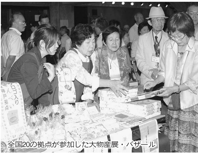
全国20の拠点に参加した大物産展・バザール