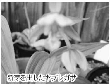
新芽を出したヤブレガサ

隣家との間であまり日当りが良くないけれど、鉢も小さいから場所をあまりとらなくて良いかと思っ始めました。毎日の水やりや草抜