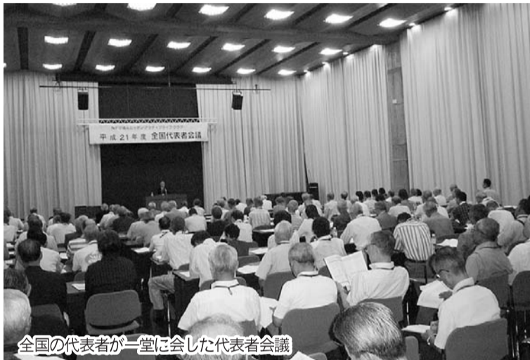
全国の代表者が一堂に会した代表者会議

事前に文書で質問意見を受け付けていたがその主なものは①連帯基金の拡充についての目標額や支援の条件について②時間預託以外に新しいナルクの魅力は