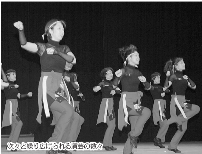
次々と繰り広げられる演芸の数々

(1面から続き) クの意義を我々に伝えてくれた。完歩者全員は壇上で、あるいは舞台の袖で80日ぶりの再会の喜びを分かち合った。