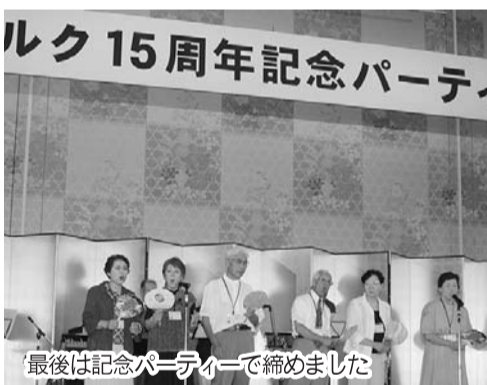
最後は記念パーティーで締めました

「地域の孫たちの成長を見るのは、何物にも代え難い充実感を味わえるし、男性会員もこの現場に