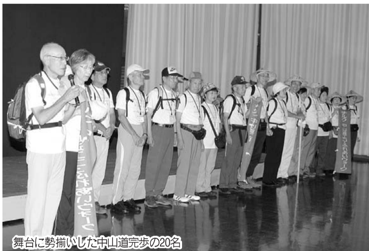
舞台上に勢揃いした中山道完歩の20名

逆私としては事業計画に対してしっかりと意見を書かせてもらっていたので、いつもの時間に追われる総会よりはこの方が良かったと思っ 「優秀会報とホームページを表彰」 このあとステージでは、15周年記念行事の一環である拠点の会報と、ホームページのコンクール表彰が行われた。 全国の多くの拠点は毎月、拠点の活動を知らせる会報を発行している。経費の関係で、あるいはスタッフの関係で隔