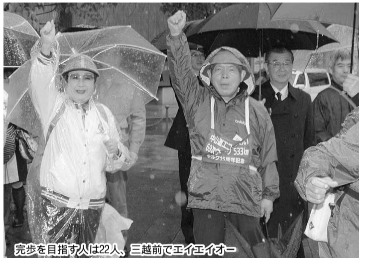
完歩を目指す人は22人、三越前でエイエイオー

中山道ウォークの出発式は4月25日(土)、午前10時30分から東京・日本橋三越屋上で開かれた。この日東京は生憎の雨。しかも式典が始まる頃から風も強くなり、ちよつと