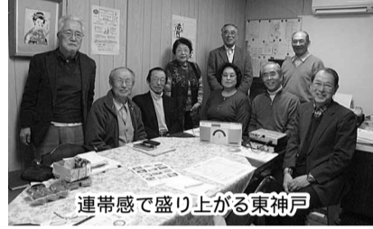
連帯感で盛り上がる東神戸

結果としての手作り事務所は交通至便な阪神電鉄神戸線・青木(おおき)駅前にあります。ナルク東神戸を語るには事務所への取り組みが欠かせません。