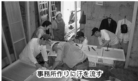
事務所作りに汗を流す

例えば、08年1月に「5年後に3000拠点、6万人のナルクにする」との高畑試案が会報ナルクに発表されましたが、それに先駆けるようにナルク神戸からの分離独立を果たしたのがナルク東神戸(07年9月設立)でした。