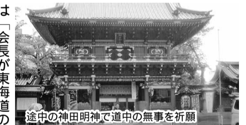
途中の神田明神で道中の無事を祈願