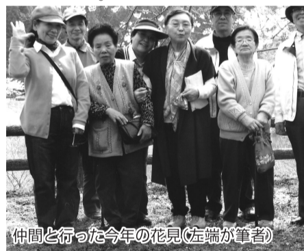
仲間と行った今年の花見(左端が筆者)

に活動させていただき、おしゃべりをしながら楽しんで元気をいただいております。 私どものクラブには色々な同好会がありますが、中でもユニークなのは「パルククラブ」です。5年ほど前にできましたが、最初は真珠に穴を開けることが難しく、失敗の連続で