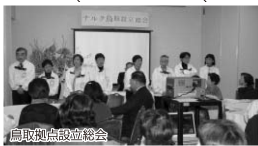
鳥取拠点設立総会

今年に入ってから 東京の足立区がS拠 点の設立が活発化 している。 S拠点というのは スモール拠点のSか らきているが、いず れ正式に拠点として 登録することを前提 としてい る。 3月 11日に 設立さ れた鳥 取もS 拠点か らの昇 格であ る。S拠 点から 設立総 会に至 る。3月 11日に 設立さ れた鳥 取もS 拠点か らの昇 格であ る。S拠 点から 設立総 会に至 る。