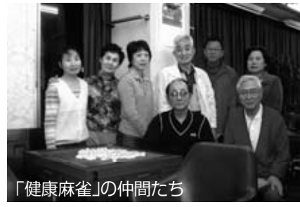
「健康麻雀」の仲間たち

ボランティアの好 縁で会員同士の出 いが生まれるが健 づくり・学習・親睦 流のイベント(最低 1回)と同好会・サ クル活動を を多彩に 活発に展 開し、そ れらのど れかに会 員がもれ なく参加 するよう になれば、 出会いは 絆の強い 人間関係に結ばれる。