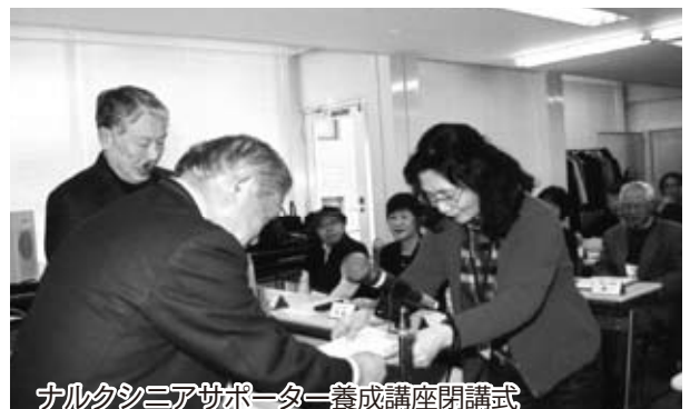
ナルクシニアサポーター養成講座閉講式

★新しく開始することになった「ナルクシニアサポーター養成講座」は、2007年度は、目標の会費納入会員1万2000人を達成した。しかしこれはマスメディアのおかげで、2008年度は自力で会員を増やし、退会者を大幅に減らして、1万3